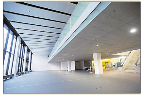
VON BADEN NACH AARAU Die AZ-Redaktion zieht in diesen neuen Raum ein. EFU