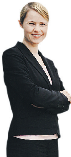
Natalie Rickli, 32, ist SVP-Nationalrätin und war Gemeinderätin in Winterthur und Zürcher Kantonsrätin. Beruflich ist sie Partner Relation Manager für die Goldbach Media und die IP Multimedia AG.